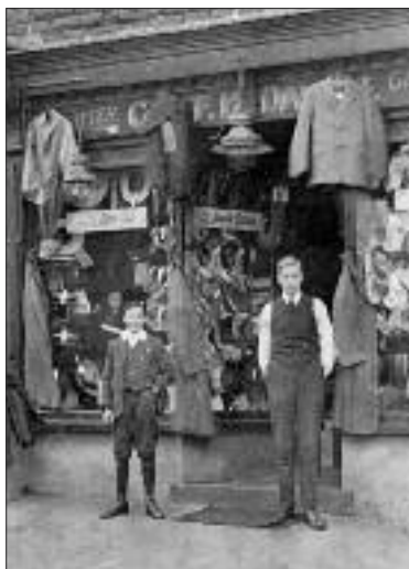
Siop Bridge House