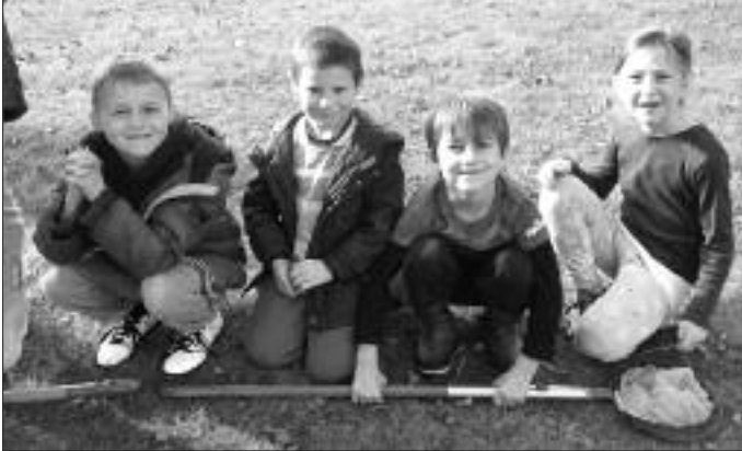
Chwilio am greaduriaid bach

Wedi gwyliau'r hanner tymor treuliodd blant Blwyddyn 3 dridiau diddorol ac anturus ar gwrs preswyl ym Mharc Gwledig Margam. Cawsant gyfleoedd gwych i ddysgu am yr amgylchfyd mewn ffordd cyffrous ac uniongyrchol. Gwelsant geirw o bob maint yn carlamu ar ben y mynydd a dysgu am fywyd gwyllt ac am drychfilod bach. Uchafbwynt y cyfnod yno oedd ymdrochi a neidio i'r llacs a chael eistedd o gwmpas y goelcerth a thostio 'marshmallows' blasus.