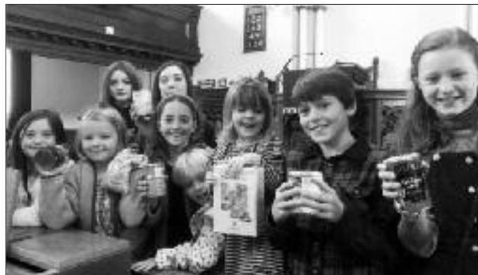
Plant Ysgol Sul Soar gyda'u rhoddion ar gyfer banc bwyd Pantri.