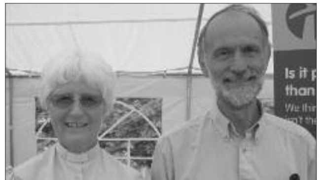
Y Parchg Pam a'r Dr Alan Cram