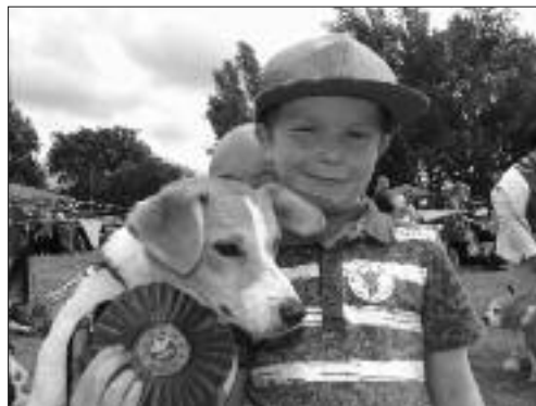
Enillydd y gystadleuaeth "ci yn debyg i'w berchennog" yng Ngŵyl Clydach

Yn dilyn gŵyl a ffair Pontardawe ym Mehefin a effeithiwyd gan law trwm cynhaliwyd gwyl lwyddiannus ar gae Waverley, Clydach dan nawdd y Cyngor Cymuned. Dyma'r tro cyntaf i'r Cyngor fentro ar ddigwyddiad mor uchelgeisiol. Prynwyd pebyll a gwahoddyd mudiadau ac unigolion lleol i osod byrddau er mwyn gwerthu nwyddau a chynnyrch. Bu'n ddiwrnod braf ar gyfer sioe gwn a chyfle i anrhegu'r trigolion lleol am eu hamdrechion garddio.