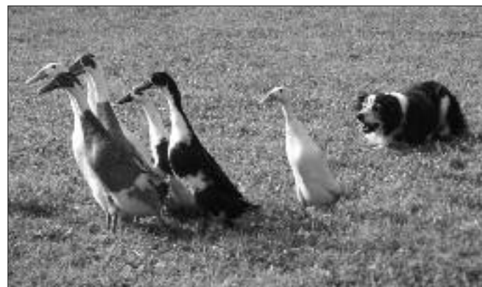
Y ci yn corlannu'r hwyaid