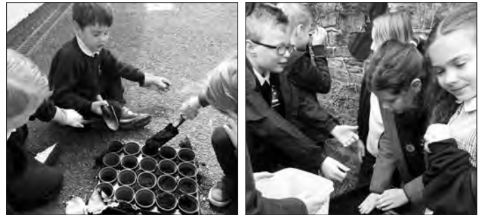
Disgyblion Trebannws yn plannu hadau

Am gyfnod prysur i ddisgyblion yr ysgol ers gwyliau'r Pasg! Fel rhan o'r Wythnos Dysgu yn yr Awyr Agored, mae'r plant wedi bod yn plannu hadau o bob math, megis blodau'r haul, ffa, pys, ciwcybr, yn ogystal â blodau sy'n denu gwenyn. Mae planhigion tomato, letys a thatws eisoes yn tyfu yn ein gardd.