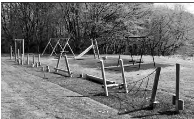
Parc Allt-y-grug ar ei newydd wedd.

Mae Cyngor Cymuned Ystalyfera yn falch o gyhoeddi bod eu cais am gyllid gan dîm Plant a Theuluoedd NPTCBC i adnewyddu offer chwarae ym Mharc Allt-y-grug, Ystalyfera wedi'i gymeradwyo! Derbyniwyd £20,000 o gyllid ar gyfer y prosiect a fydd yn cynnwys sêd siglo, basged gynhwysol newydd, bowlen sbinio gynhwysol, llithren a llwybr antur i gyd wedi eu gwneud o bren. Cyfanswm cost y prosiect hwn yw £24,999 (gyda'r gweddill o £4,999 yn dod o gyllideb Cyngor Cymuned Ystalyfera). Gobeithiwn y byddwch chi a'ch plant yn mwynhau'r parc ar ei newydd wedd.