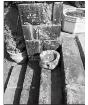
Y felin law wrth fôn wal Capel y Baran

Taith fach y mis hwn. Dechreuais o Railway Terrace sef Lôn Hir erbyn hyn. Mae'r tai i gyd ar y dde ac mae un o fy atgofion am y gerddi bach, y rhandiroedd neu'r 'allotments' ar y chwith yn ystod yr Ail Ryfel Byd. Bron ar ben y stryd y mae agoriad